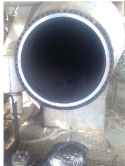
Superficie maquinada

El trabajo se realizó en 4 horas con una refrentadora / biseladora portátil CLIMAX FF6000 que pesa sólo 189 kg, capaz de maquinar diámetros hasta 60”, accionada por un motor neumático de 1.5 HP (con 45.0 CFM @ 90 PSI), y con una velocidad de hasta 22.5 RPM. Este equipo permite el refrentado, biselado y escuadrado en sitio. El ajuste se hizo con llaves hidráulicas de torque, y el intercambiador pasó la prueba hidrostática – a la primera.