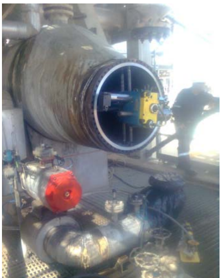
Refrentadora instalada

Por las dimensiones del equipo, el trabajo tenía que hacerse en sitio. Para garantizar el ajuste correcto, también se nos encargó el ajuste con llaves hidráulicas de torque.