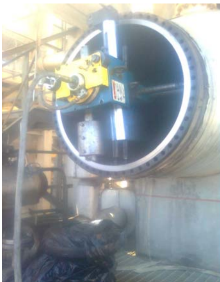
Refrentadora maquinando