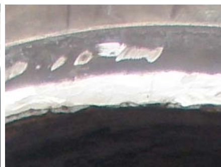
Detalle relleno de soldadura