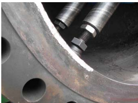
Anclaje de la refrentadora

La superficie de sellado de una brida de 26” de diámetro en una refinería se había picado y para recuperarla se tuvo que rellenar primero estas imperfecciones con soldadura, para luego maquinarla y garantizar así su planitud y sellado. El trabajo tenía que hacerse en sitio (a 8 m sobre el piso), ya que la brida no podía ser desmontada.