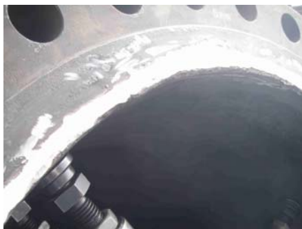
Anclaje y superficie afectada