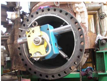
Refrentadora instalada