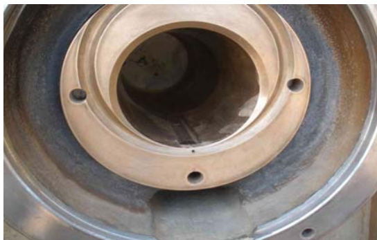
Alojamiento con bocina