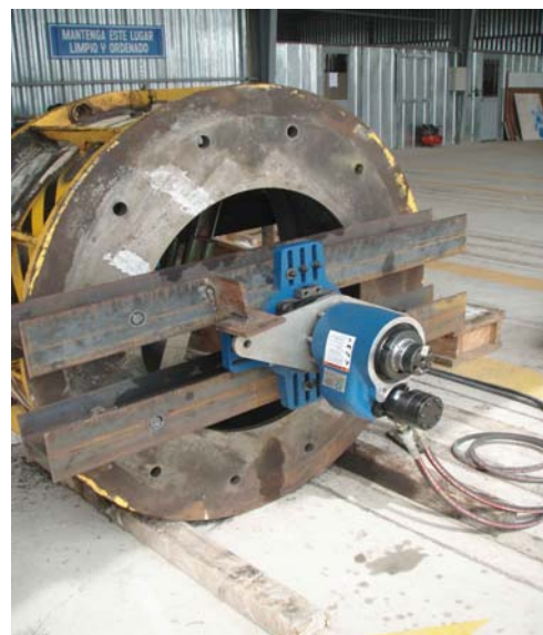
Fuente: P2021854 .JPG Lado motriz, con motor hidráulico