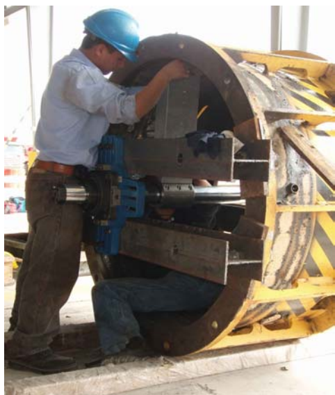
Fuente: P1311766.JPG Centrando la barrenadora