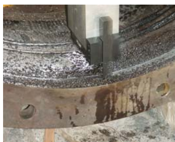
Maquinando la superficie